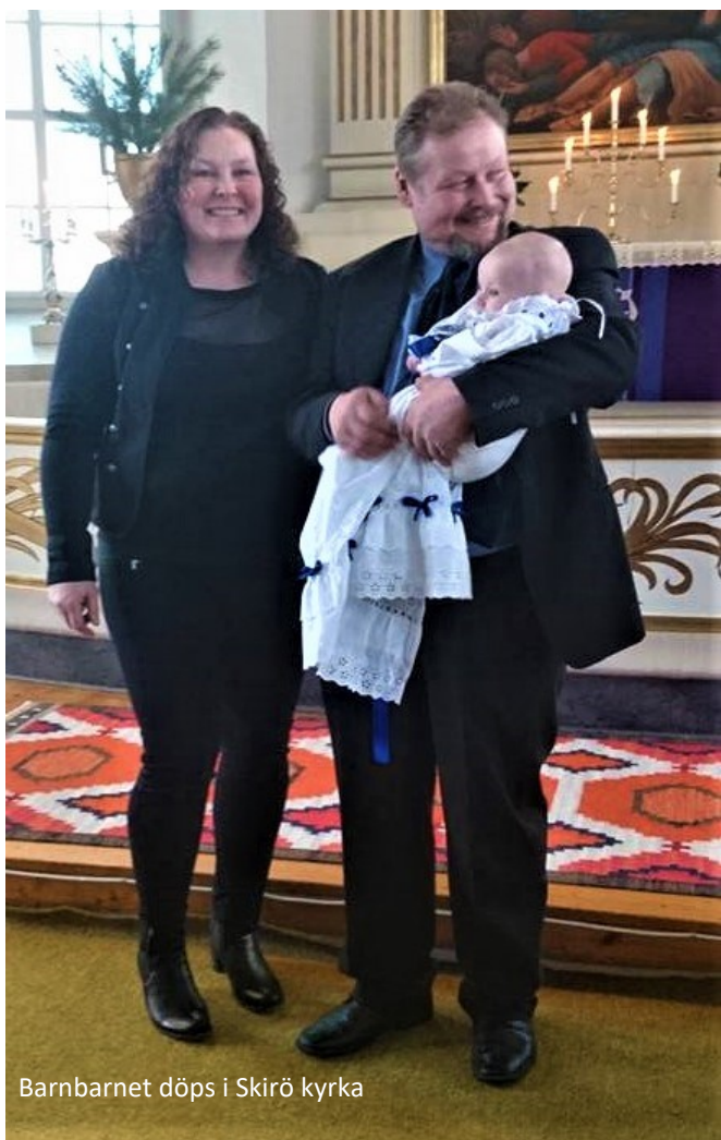
Barnbarnet döps i Skirö kyrka