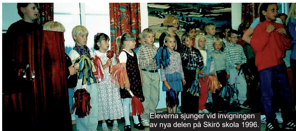
Eleverna sjunger vid invigningen av nya delen på Skirö skola 1996.