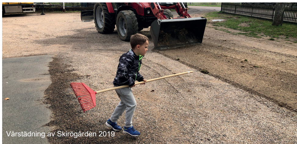
Vårstädning av Skirögården 2019