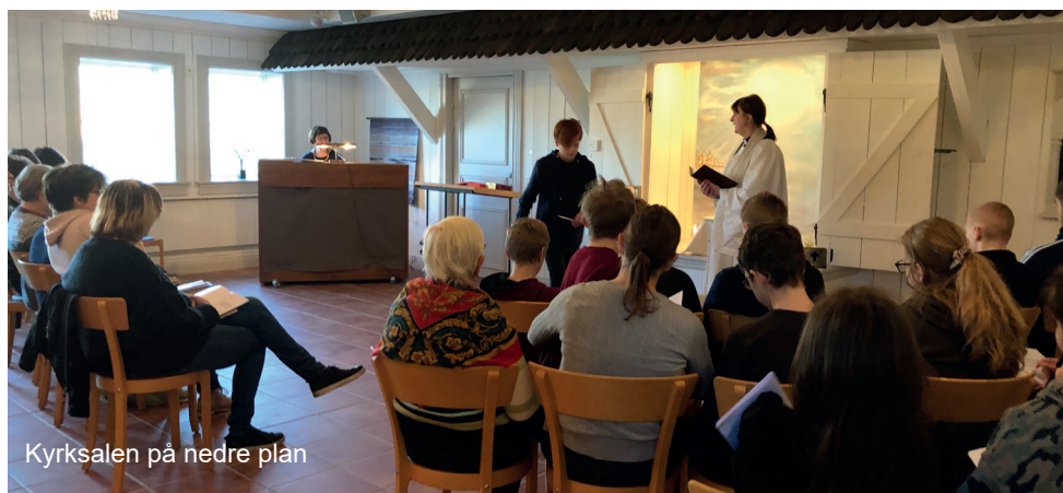
Kyrksalen på nedre plan