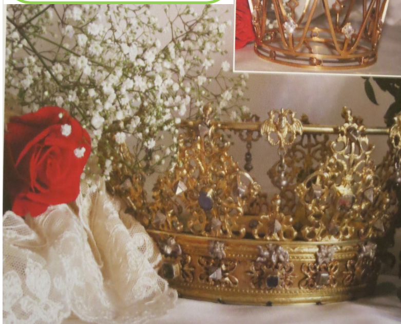
Skirös två brudkronor från 1693 och 1988.

Den andra är också gjord i förgyllt silver och inköptes och skänktes av diakonikretsen i Skirö 1988