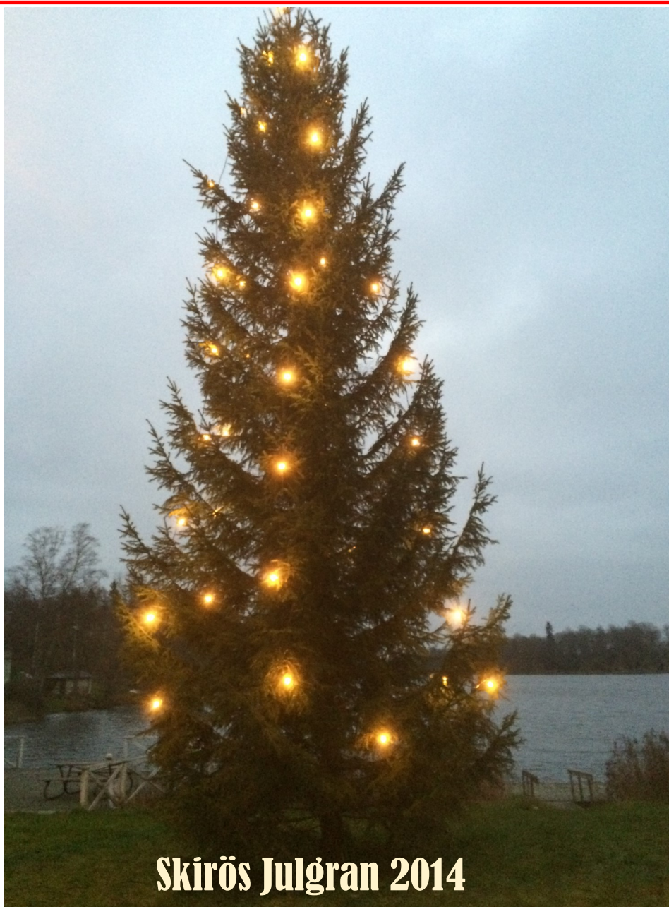
Skirös Julgran 2014

LUCIA kommer till Skirö kyrka onsdagen den 10 december klockan 18.00. Det är skolbarn från Skirö och Kvillfors som lussar