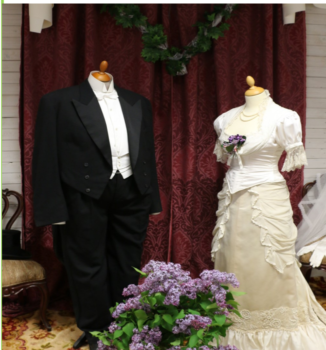
Bröllop och kärlek är temat på utställningen i Virserums konsthall