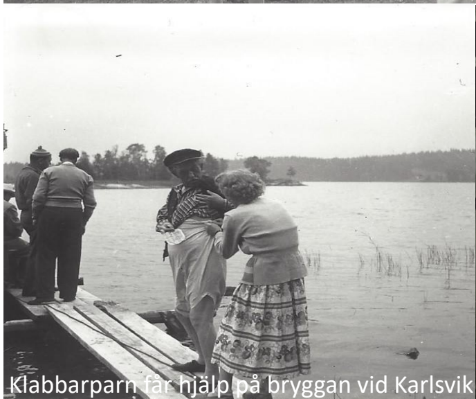
Klabbarparn får hjälp på bryggan vid Karlsvik