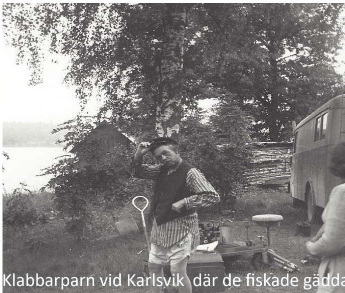
Klabbarparn vid Karlsvik där de fiskade gädda