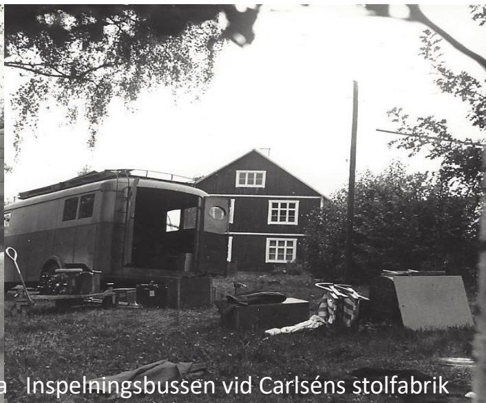
Inspelningsbussen vid Carlséns stolfabrik