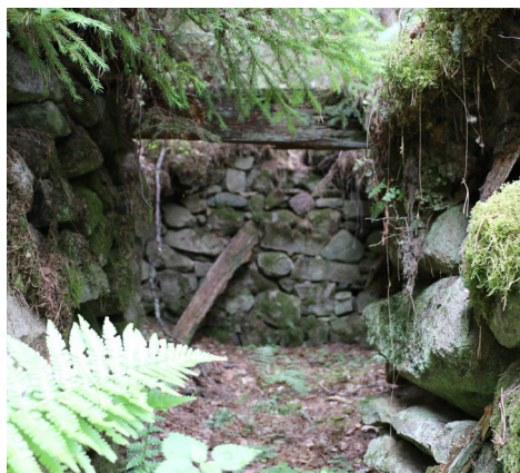
Av taket på den gamla jordkällaren i Österslätt finns bara en en hanbjälke kvar.

Nya efternamn tilldelades soldaterna. Det kunde vara adjektiv som uttryckte en egenskap som ansågs fördelaktig för en soldat såsom Rask, Kvick, Frisk eller substantiv med militäranknytning som Dolk, Lantz och Sköld eller efter naturen som Björk, Ask, Berg och Gran. Namnet var knutet till roten och en nyrekryterad soldat